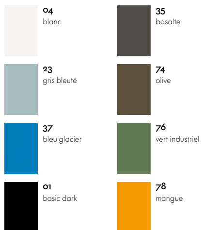
Siège à coque synthétique