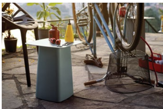
Metal Side Table (Outdoor)

Les Metal Side Tables galvanisées, dotées en option d'une finition époxy finement structurée, sont des tables d'appoint résistantes aux intempéries et disponibles en plusieurs tailles.